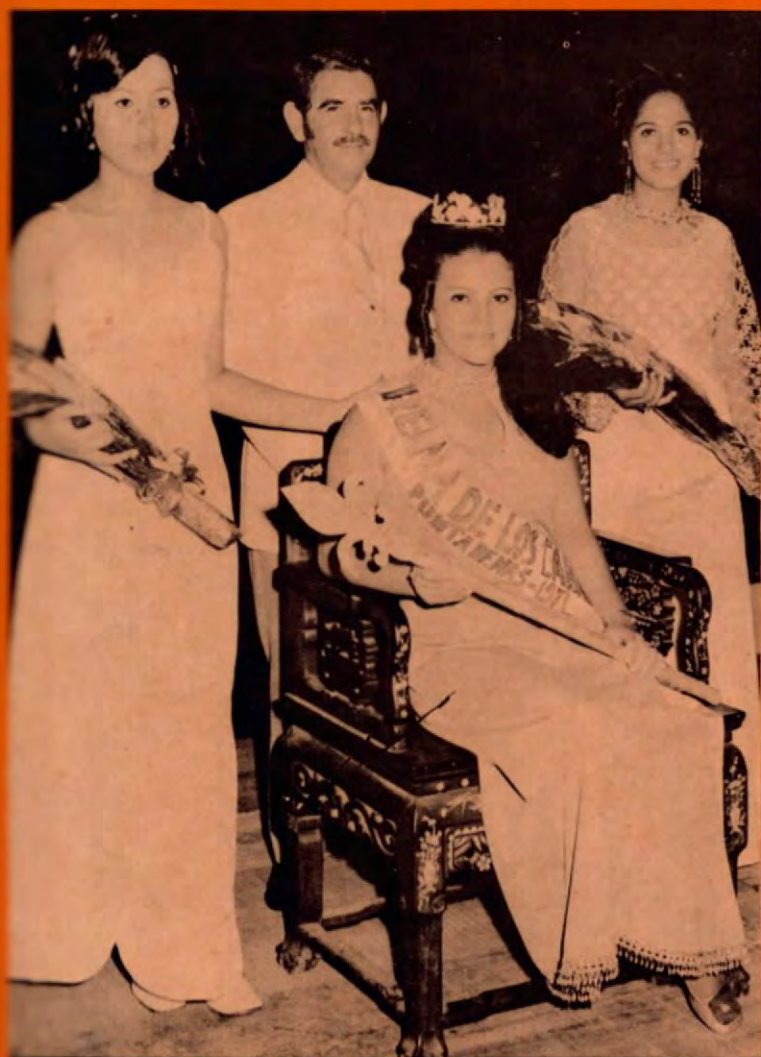
S. M. LUPITA 1a.