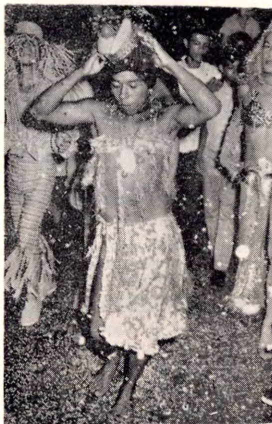
Los más pintorescos y estrambóticos disfraces se vieron en esos desfiles de alegría y locura.

Es carnaval (carne asada. Cuántas) Es carnaval (chuchecas con limón) Es carnaval (pipas frescas están) Es carnaval (todo el mundo a gozar) Es carnaval (las penas a olvidar) Es carnaval (bajo de una palmera) Es carnaval (yo te voy a besar) Es carnaval... (se repite toda).