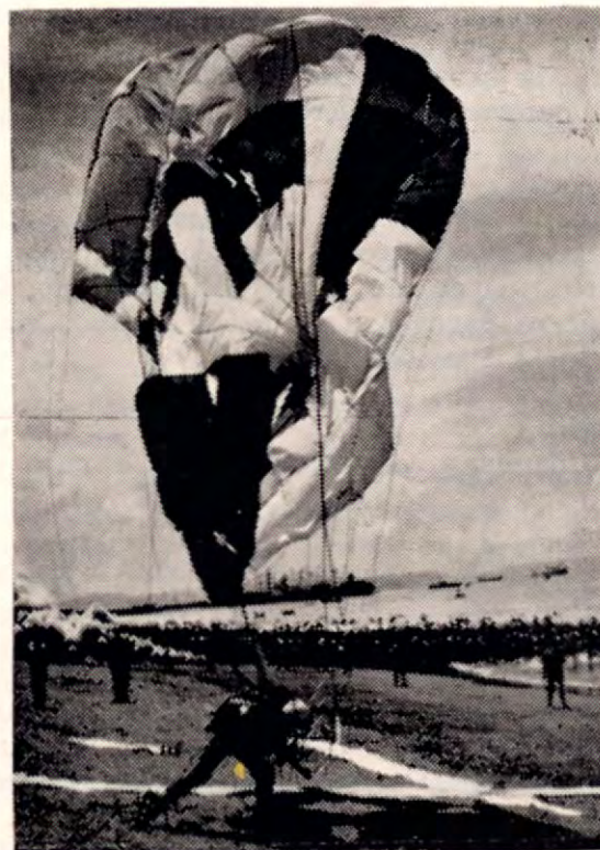
Novedosos números del programa, fueron las exhibiciones de paracaidismo en las playas de Puntarenas, con que la Fuerza Aérea de los Estados Unidos obsequiara a los puntarenenses y el turismo que nos visitara.